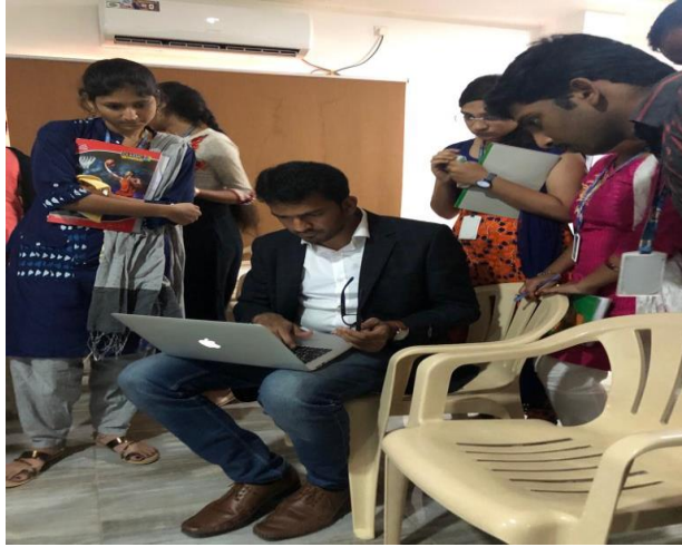
Student Interactions and Doubt Clarifications on Block Chain Projects