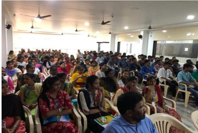
Final Year and Third Year Students Gathered for Tech Talk on Cyber Security