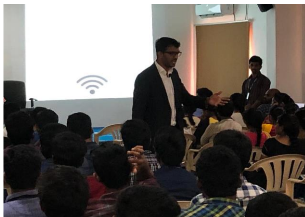
Disussion Wiress Fedility and the Versions of IEEE 802.11