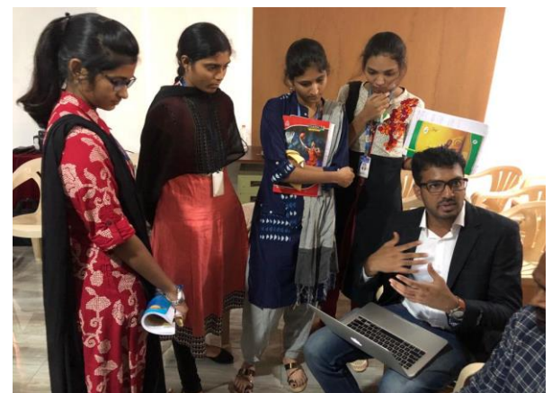
Student Interactions and Doubt Clarifications